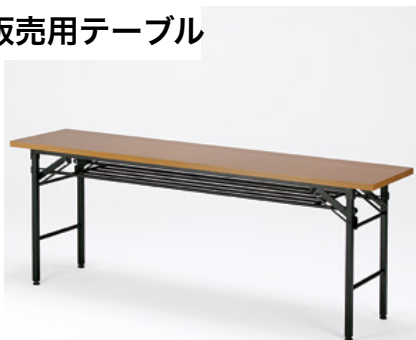
■販売用テーブル (W1800×D450) ¥1,500-消費税込