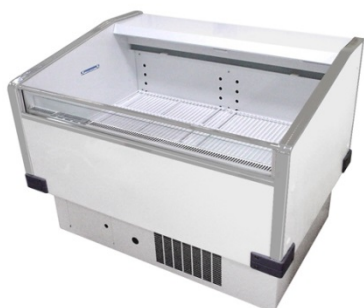
■冷蔵オープンケース6尺 ¥35,000-消費税込