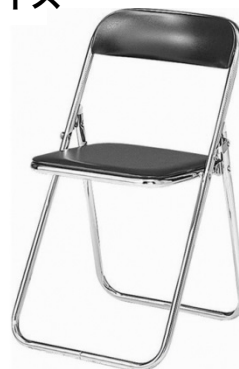
■パイプイス ¥500-消費税込