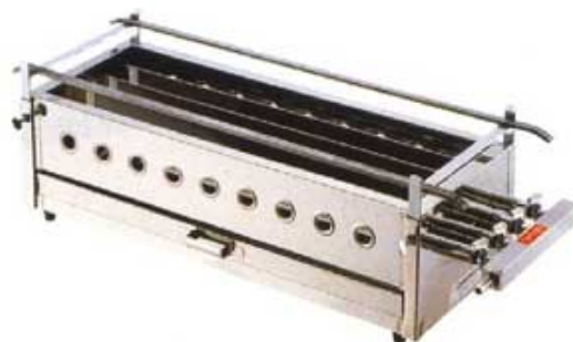
■焼き台 (LPガス1本付属) ¥18,000-消費税込