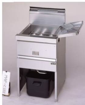
■フライヤー (LPガス1本付属) ¥25,000-消費税込